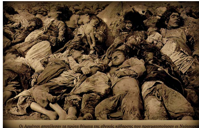
Οι Αρμένιοι αποτέλεσαν τα πρώτα θύματα της εθνικής καθάρσης που πραγματοποιήσαν οι Νεότουρκοι