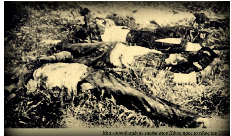
Μια «συνηθισμένη» εικόνα στον Πόντο προς το τέλος του 1920

Επίσης, ο Κεμάλ έδωσε πολιτική νομιμοποίηση, χρήμα και όπλα στον αρχηγό συμμορίας εκατοντάδων τσετών, με εντολή να «τελειώνει» με τα ελληνικά χωριά του Πόντου. Μάλιστα, σκότωσε εκατοντάδες κληρικούς, διανοούμενους και επιχειρηματίες που αποτελούσαν την κεφαλή και την αφρόκρεμα του ποντιακού Ελληνισμού.